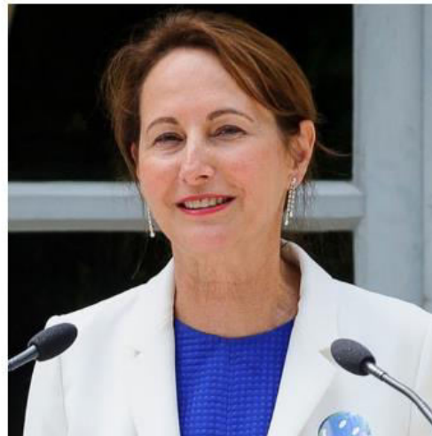
Mrs Ségolène Royal

Director General of DG Environment, European Commission