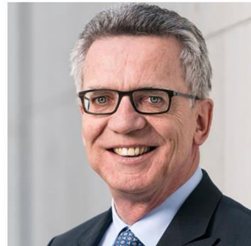
Mr Thomas de Maizière

Minister of Ecology, Sustainable Development and Energy, France